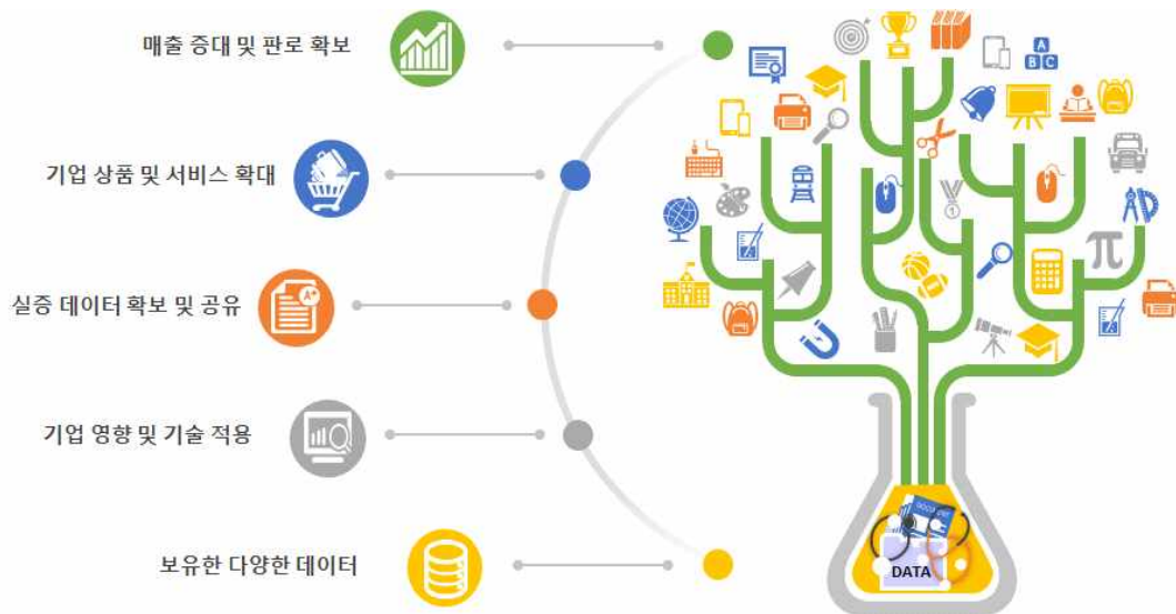
<데이터 기반 다양한 비즈니스 모델을 통한 실증데이터 확보 및 상용화>